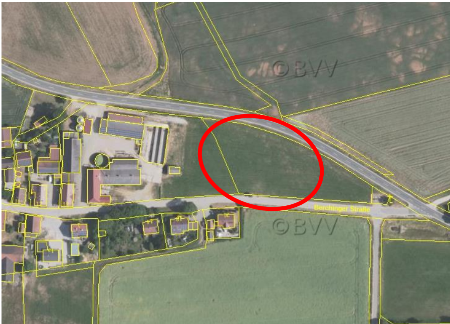
Abb.: Luftbild des Geltungsbereichs

Außerhalb des Geltungsbereichs mit einer Entfernung von 45 m befindet sich im Osten das Landschaftsschutzgebiet Schutzzone im Naturpark "Altmühltal" (LSG-00565.01). Dieses wird durch die Planung nicht berührt. Auch weitere Schutzgebiete oder Biotope sind von der Planung nicht betroffen